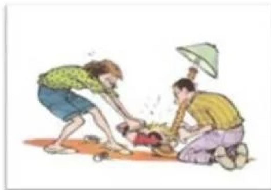
Entender o porquê do comportamento nos leva a agir de forma mais adequada.